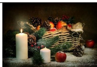
А) Новый год